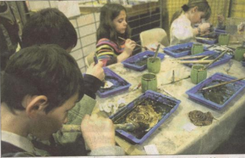
L'atelier pédagogique de la bourse aux minéraux et fossiles a été pris d'assaut hier par les scolaires.

Pratique L'exposition de la Bourse aux minéraux et aux fossiles a lieu jusqu'à dimanche salle des Costières de 9 heures à 19 heures. Prix d'entrée : 3,50 € pour les adultes et 1,50 € pour les enfants. 06 46 47 10 67 www.expo-mineraux-nimes.fr